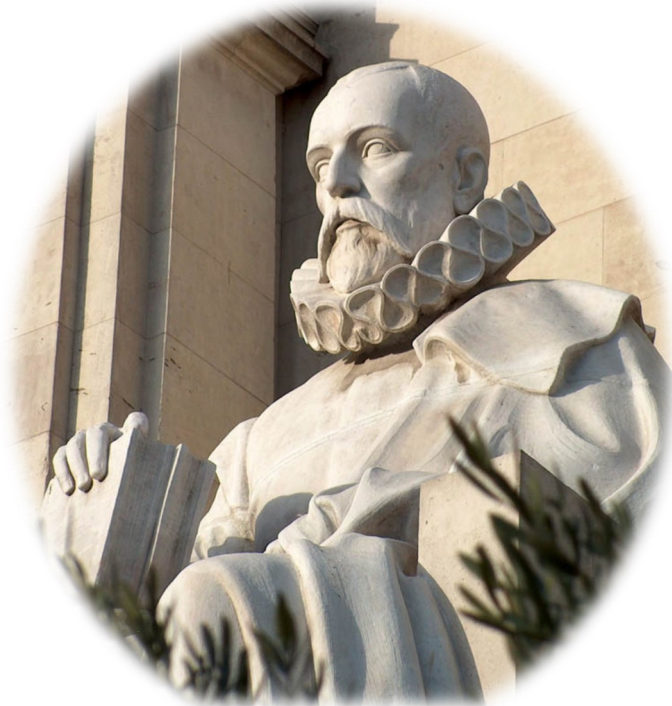
Miguel de Cervantes Saavedra